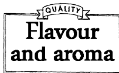
Trieda 30: Káva