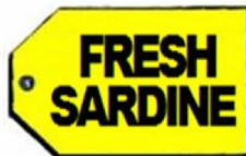
Trieda 29: Sardinky